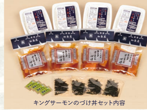
キングサーモンのづけ丼セット内容

◆限定品につき、詰め合わせの内容変更は承っておりません。 ※商品のパッケージデザインは写真と異なる場合があります。