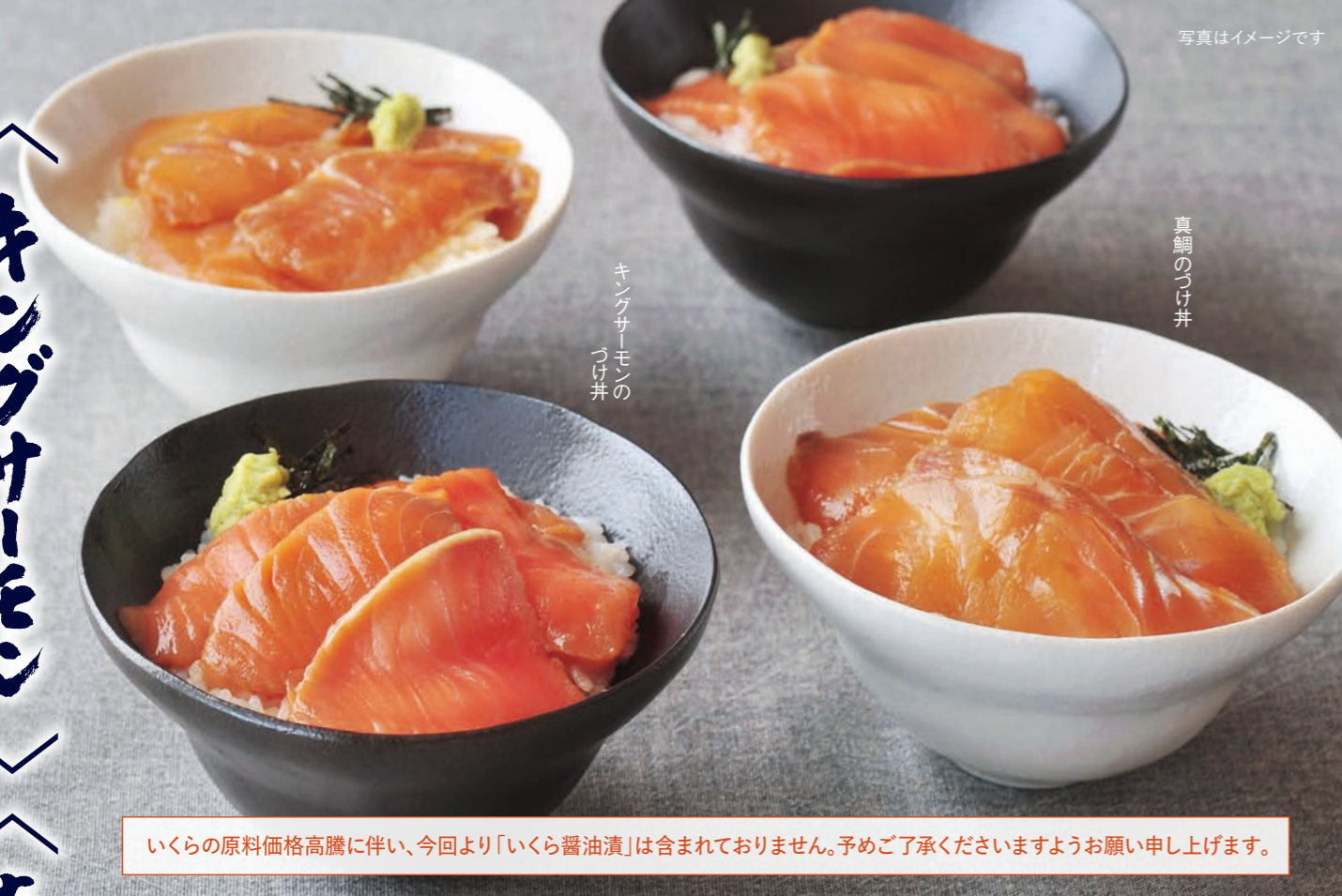
キングサーモンの づけ丼