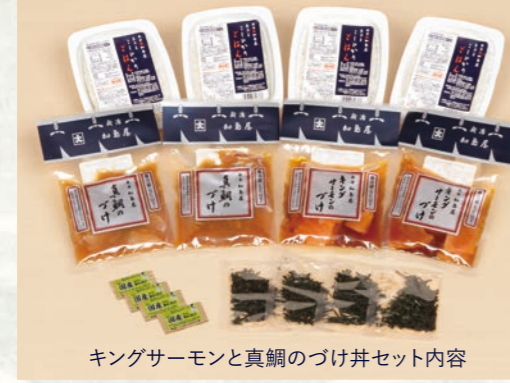
キングサーモンと真鯛のづけ丼セット内容