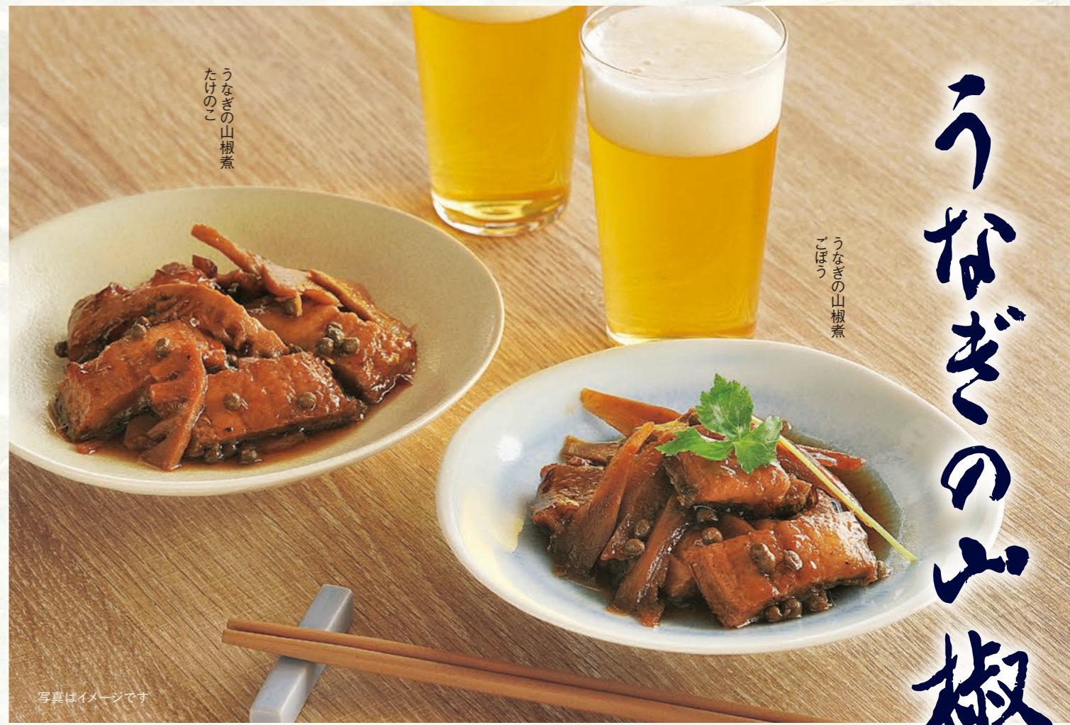
うなぎの山椒煮 たけのこ

◆限定品につき、詰め合わせの内容変更は承っておりません。 ※商品のパッケージデザインは写真と異なる場合があります。